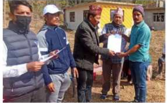
यसै गाउँपालिका अन्तर्गत वडा नं. ७ को भूमिहीन सुकुम्बासी, भूमिहीन दलित तथा अव्यवस्थित बसोबासीहरूलाई जग्गाको निस्सा वितरण कार्य गर्दाको केही भलकहरू