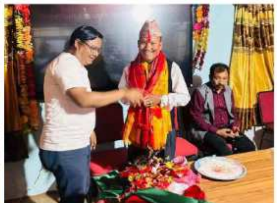
"फेरि भेटौला तथा स्वागत कार्यक्रम"