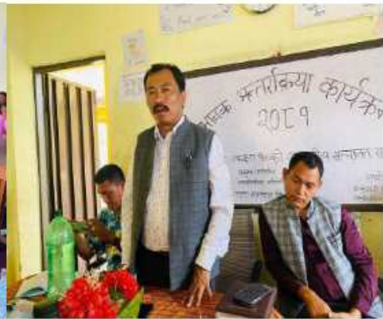
श्री कुमारी मा.वि. विधालयमा अभिभावक अन्तर्क्रिया र आवासिय सञ्चालन सम्बन्धमा छलफल समै अन्तर्क्रियात्मक गर्दाको केही भ्रमक ।