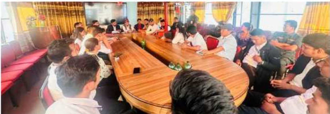
“मासिक प्रगति समिक्षा कार्यक्रम” - मासिक प्रगति समिक्षाको क्रममा कैद नरिएका तस्विर