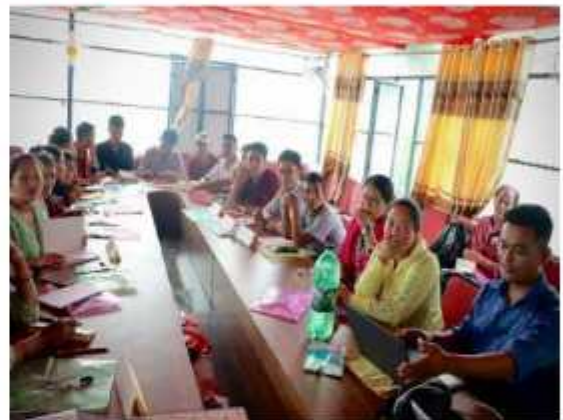
विद्यालयका शिक्षक, शिक्षिकाहरूलाई तामाङ्ग मातृ भाषा शिक्षण सम्बन्धी ५ दिने अभिमुखिकरण कार्यक्रमको समापन गर्दाको केही तस्वीरहरू