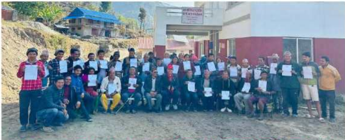
वडा नं. ४ को भूमिहीन सुकुम्बासी, भूमिहीन दलित तथा अव्यवस्थित बसोबासीहरूलाई जग्गाको निस्सा वितरण कार्य सम्पन्न भएको छ ।