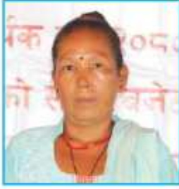
चिमोँ माया घिसिड