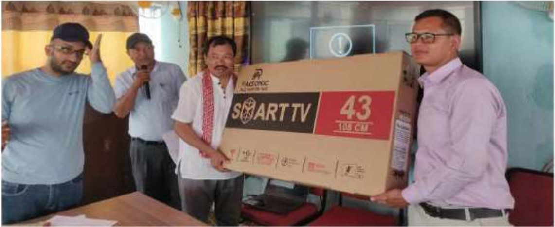
खानीखोला गाउँपालिकाद्वारा १२ वटा स्कुलहरूलाई बालकक्षाको (बालबिकास) लागि कबचत त्थ वितरण गर्दाको केही भलक