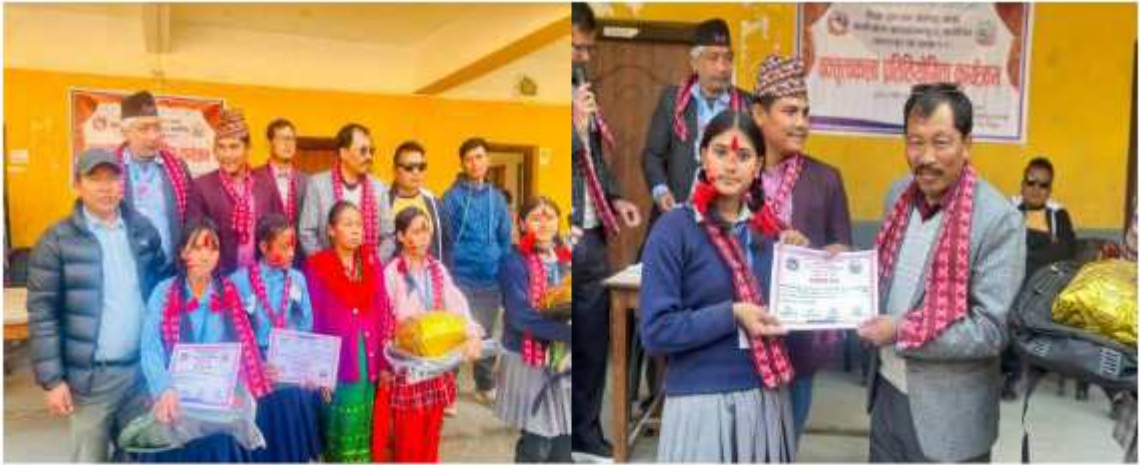
“अतिरिक्त क्रियाकलापको संचालन, बाल प्रतिभाको प्रष्कटन” भन्ने नाराका साथ शिक्षा, युवा तथा खेलकुद शाखाद्वारा आयोजित आधारभूत तह (कक्षा १-८) “सम्भावना यही छ” भन्ने शिर्षकमा वक्तृत्वकला प्रतियोगिता कार्यक्रमको केही भलक