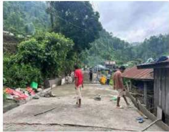
गाउँपालिकाको केन्द्रमा ढलान गर्ने क्रममा कैद गरिएका तस्वीरहरू