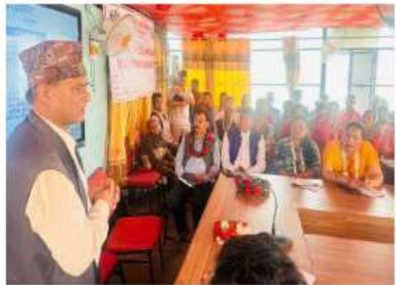
खानीखोला गाउँपालिकाको आन्तरिक राजस्व अभिवृद्धी सम्बन्धी दुई दिवसिय कार्ययोजना निमार्ण कार्यशाला गोष्ठीको केही भल्लकहर