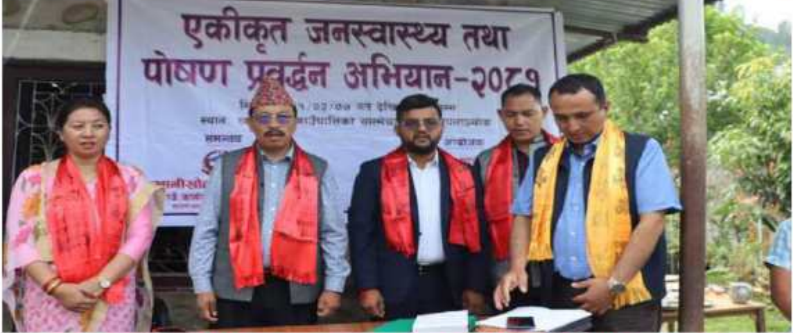
"निःशुल्क स्वास्थ्य शिविर कार्यक्रम" - २ दिने निःशुल्क स्वास्थ्य शिविर तालुङ्गा स्वास्थ्य चौकी, ०५ मा आयोजनाको भलक