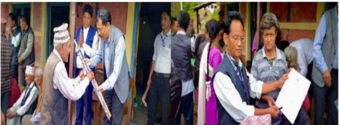
खानीखोला गाउँपालिका वडा नं. १ को सामाजिक सुरक्षा भत्ता वितरण साथै जेष्ठ नागरिकहरूलाई गाउँपालिकाद्वारा घाता र सौरो वितरण साथसाथै वडा नं १ का भूमिहीन सुकुम्बासी, भूमिहीन दलित तथा अव्यवस्थित बसोबासीहरूलाई जग्गाको निस्सा वितरण गर्दाको केही भलकहरू