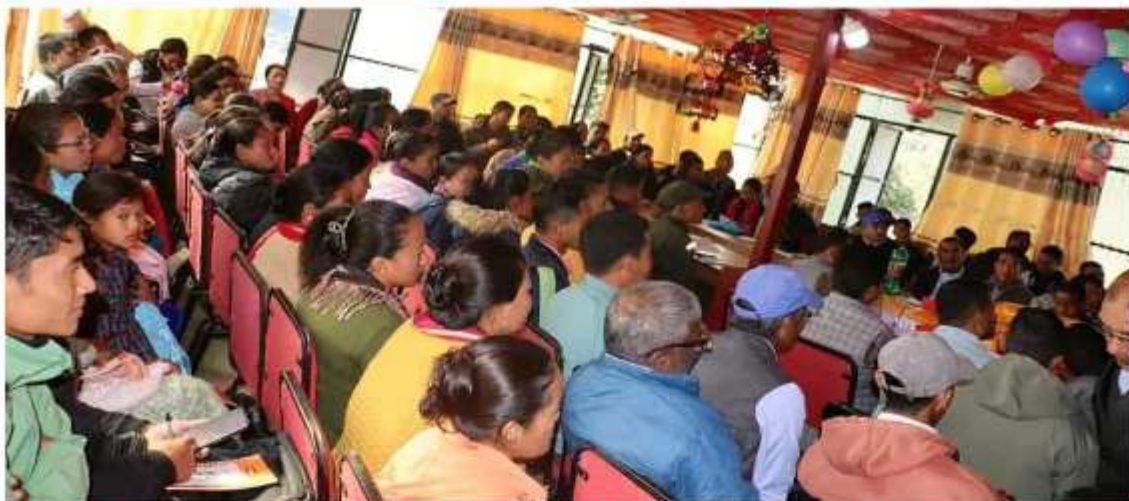
सिकाइ क्षति आपुरणका लागि न्युनतम सक्षमता र निदानात्मक परीक्षण साधन सम्बन्धी १ (एक) दिने अभिमुखिकरण कार्यक्रमको भ्रमक