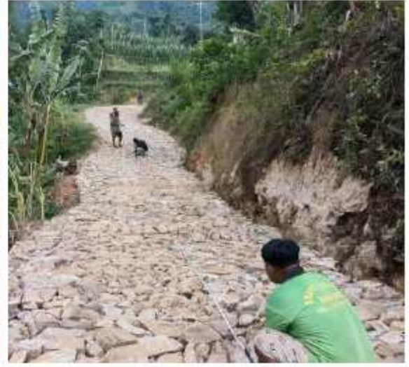
स्वरोजगारको योजना अन्तर्गत बाटो सोलिङ्ग अनुगमन गर्दाको भलक