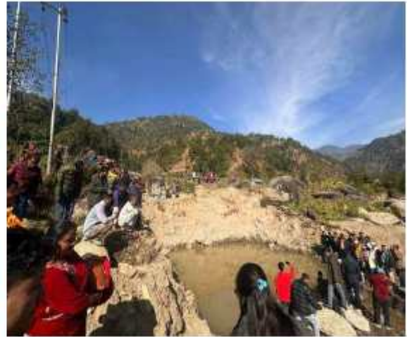
“खानीखोला गाउँपालिका ५ र ६ जोड्ने सडक पक्की पुलको शिलाब्यास कार्यक्रम सुरुम्पन्न गर्दाको केही भलक”