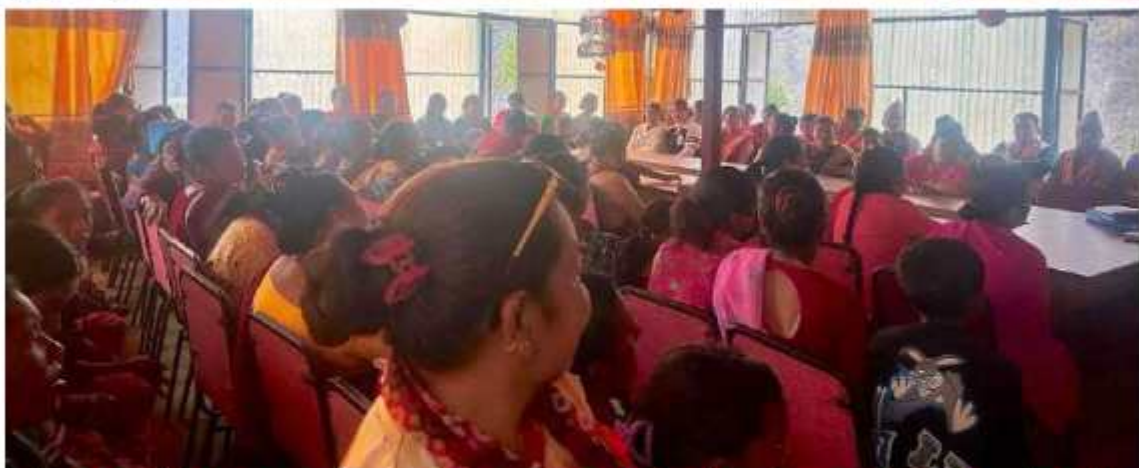
महिला तथा बालबालिका शाखाद्वारा "महिलामा लगानी सम्बन्ध र समुन्नत समाजको बालनी" भन्ने नाराका साथ ११४ औं अन्तराष्ट्रिय श्रमिक नारी दिवसको अवसरमा आयोजित अन्तरक्रिया तथा शुभकामना आदान-प्रदान कार्यक्रमको केही भलकहरू