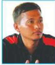
दशरथ लामा २ नं. वडा अध्यक्ष