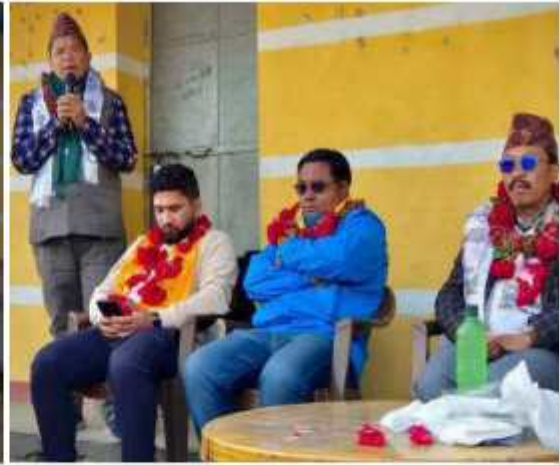
वडा नं ३ धनमनामा मोटरबाटोको टुर्बाक खोल्ने काम सम्पन्न भएपछी स्थानियहरुबाट आवोजना गरिएको धन्यवाद ज्ञापन कार्यक्रम