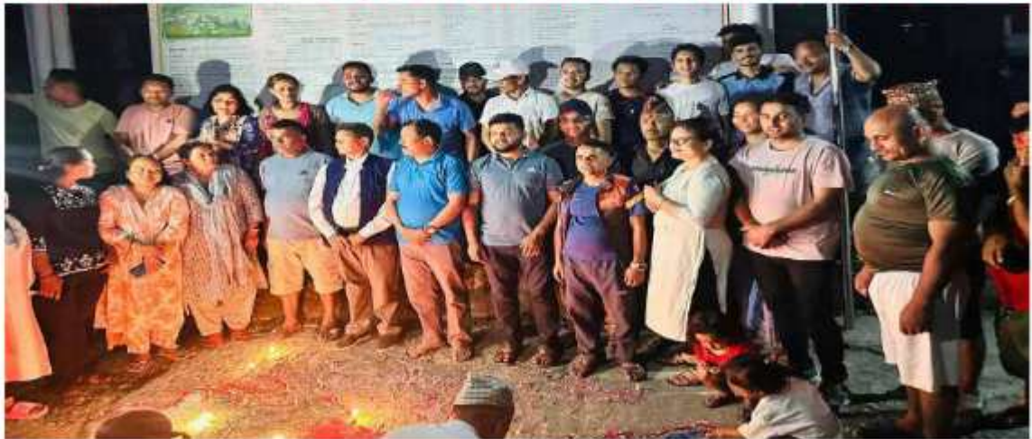
"१७ औं गणतन्त्र दिवस दिप प्रज्ज्वलन सहित गणतन्त्र दिवस भव्यताका साथ मनाउदै सुसम्पन्न गर्दाको भल्लक"