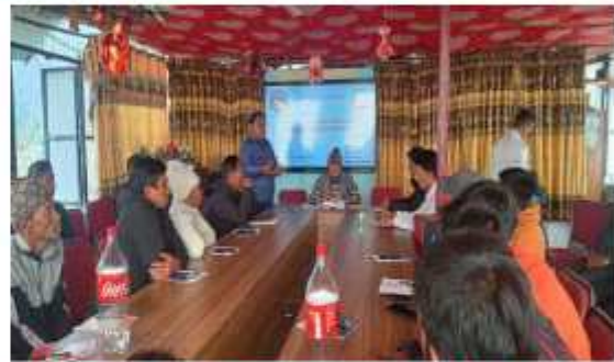
कृषक समूहका पदाधिकारीहरूसँग कृषि तथा तरकारी उत्पादक कृषक समूह परिचालन एवं अभिमुखिकरण कार्यक्रम सम्बन्धि १ दिने गोष्ठीको भूलाक