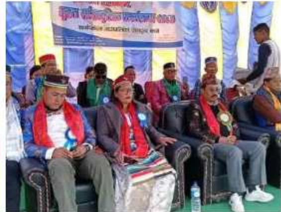
ल्लोघार पर्व भव्यताका साथ मनाउने क्रममा कैद गरिएका तस्वीरहरू