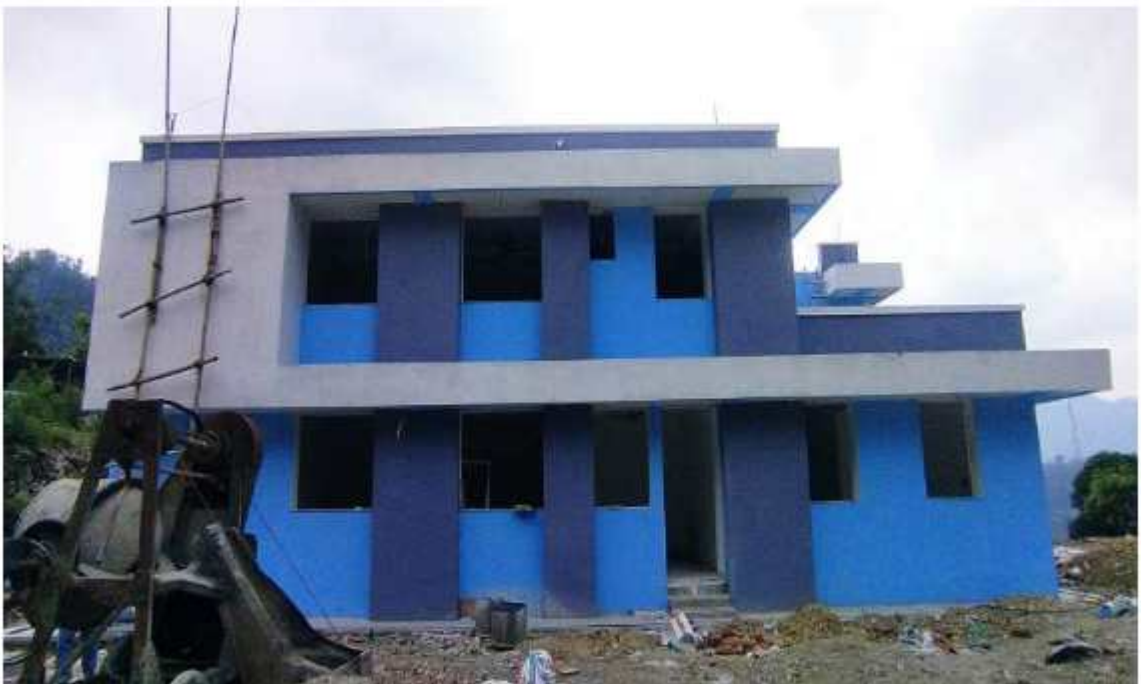
निर्माणाधिन तालुङ्गा आधारभूत अस्पतालको अनुगमन गर्दाको भलक