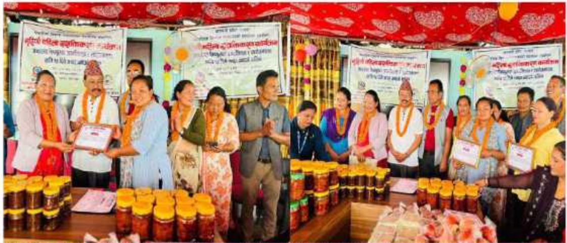
बागमती प्रदेश सरकार, सामाजिक विकास मन्त्रालय र खानीखोला गाउँपालिकाको साभन्दारी सहयोगमा जागरण नेपालको आयोजनामा सञ्चालित गृहणी महिला सशक्तिकरण कार्यक्रम समापन गर्दाको केही भ्रमलक ।