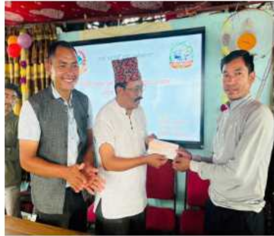
"कफीमा जसको उत्पादन उसैलाई अनुदान" कार्यक्रम अन्तर्गत कृषक समूह तथा कृषि सहकारीमा आवद्धकृषकहरूलाई गाउँपालिका अध्यक्षद्वारा अनुदान वितरण कार्यक्रम गर्दाको केही भ्रमकहरू।