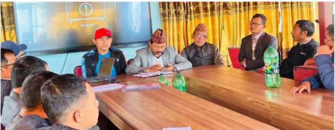
गाउँपालिकाको सभाहलमा सम्पूर्ण सामुदायिक विद्यालयका प्रधानाध्यापकज्यूहरूसँग बैठक बस्दाका केही भलकहरू ।