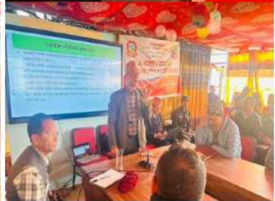
जनप्रतिनिधि र कर्मचारीकोलागि दुई दिने क्षमता विकास तालिम तथा अभिमुखिकरण कार्यक्रमको केहि भलक