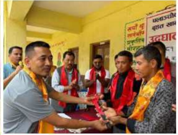
“एक घर, एक धारा” अन्तर्गत वडा नं २ फलामेटारमा सम्पूर्ण काम सम्पन्न गरि हस्तान्तरणसँगै उद्घाटन सत्र कार्यक्रम सम्पन्न गर्दको केही भलकहरू