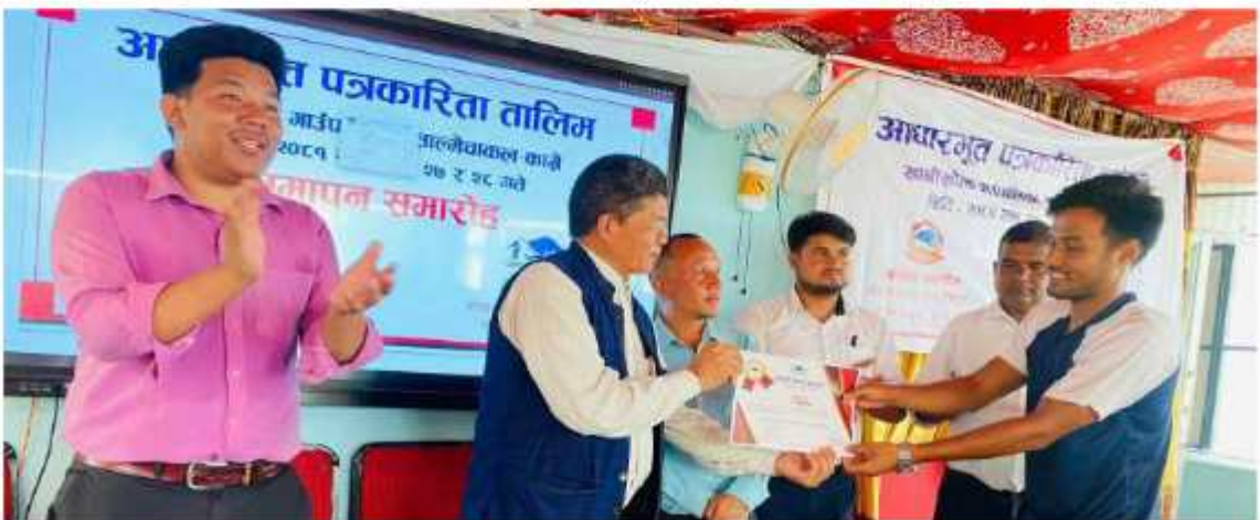
आधारभूत दुई दिने पत्रकारिता तालिम कार्यक्रम समापन गर्दाको केही भलक