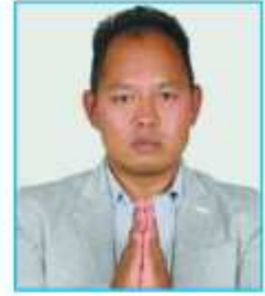
सागर लामा ३ नं. वडा अध्यक्ष