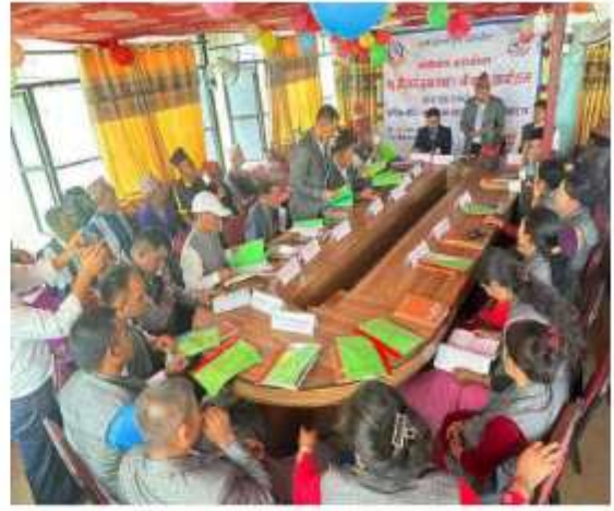
"मिति २०८१ साल अषाढ १० गतेका दिन १५ औं गाउँसभा तथा ८ औं बजेट अधिवेशन समापनको केही भल्लक"