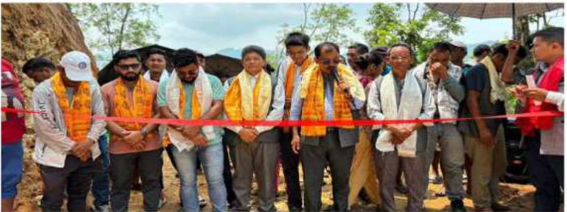
वडा नं ७ मा सुकुमफेदि-पाक्दोल-देउपाल-महाडाल-तालुङ्गा सडकको ट्रयाक अनुगमन गरि उद्घाटन गर्दको केही भलकहरू