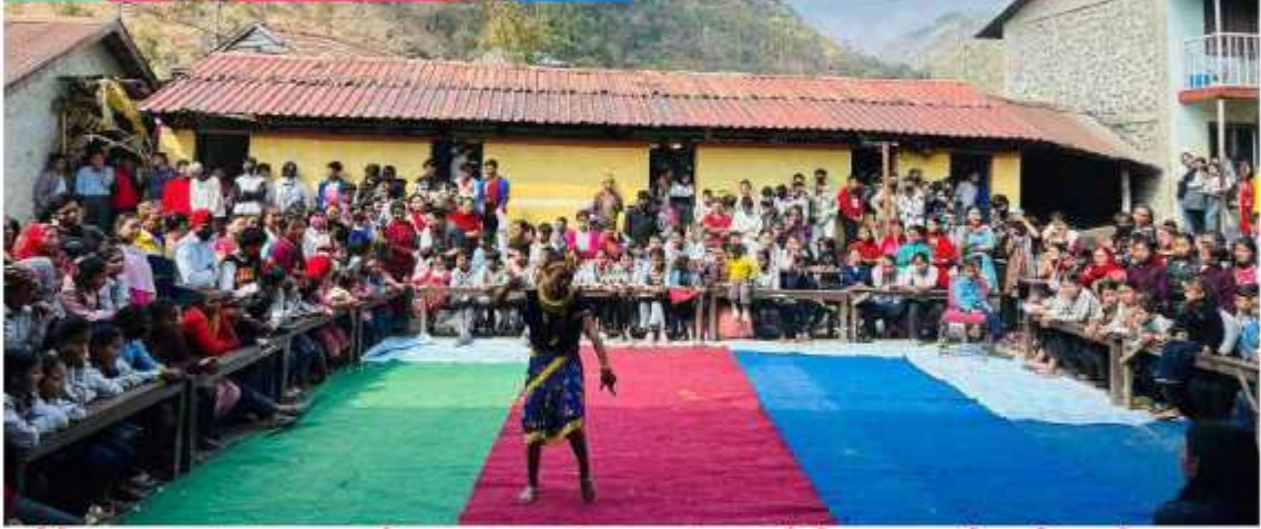
अतिरिक्त कथाकलापको संचालन, बाल प्रतिभाको प्रस्फुटन भन्ने मुल नाराको साथ गाउँपालिका द्वारा आयोजित पालिका स्तरिय खुल्ला नृत्य प्रतियोगिता कार्यक्रम भव्य रुपमा सम्पन्न गर्दाको भ्रलक