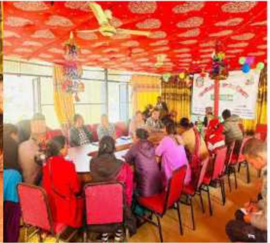
"यस खानीखोला गाउँपालिकाको हिउँदे अधिवेशन (चौथो गाउँसभा) का केही भलकहरू"