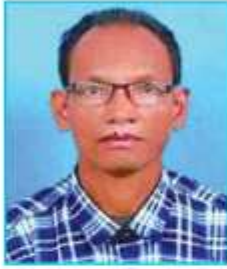
सन्तमान थिङ्ग १ नं. वडा अध्यक्ष