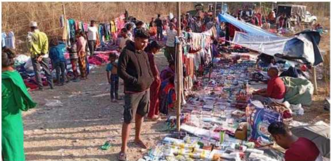
हरेक हप्ताको आईतबार लाग्ने ताल्दुङ्गा हाट बजारको तस्विर