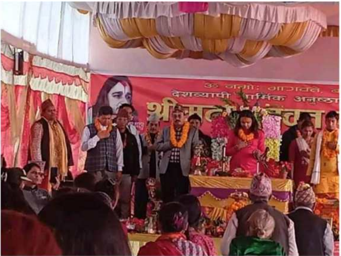
खानीखोला गाउँपालिकामा सञ्चालित श्रीमद्भागवत सप्ताह ज्ञानवृद्धि को केही भलकहरू