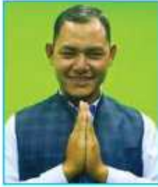
निशान मुक्तान ४ नं. वडा अध्यक्ष