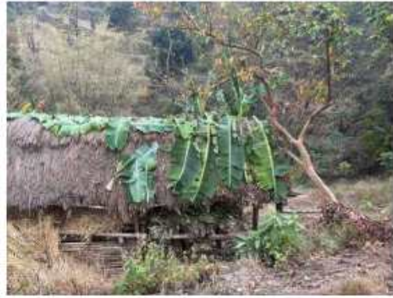
विपद्को क्रममा खटिनु हुँदै गाउँपालिका प्रहरी टोली