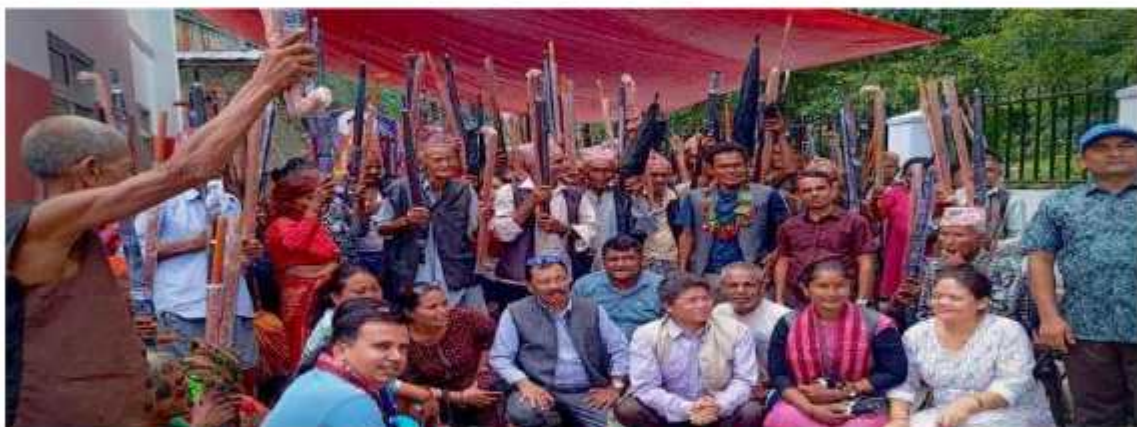
वडा नं. ५ का अशक्त, जेष्ठ नागरिकहरूलाई सम्मान तथा घाता र लौरो वितरण कार्यक्रम सम्पन्न