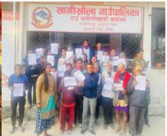
यसै गाउँपालिका अन्तर्गत वडा नं. ५ र ६ को भूमिहीन सुकुम्बासी, भूमिहीन दलित तथा अव्यवस्थित बसोबासीहरूलाई जग्गाको निस्सा वितरण कार्य सम्पन्न गर्दाको केही भलकहरू ।