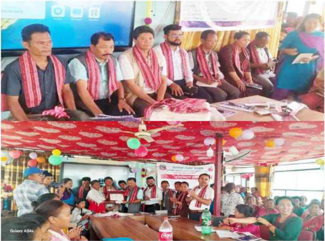
"श्रमको सम्मान राष्ट्रको अभियान" भन्ने नारा सहित समयमै कार्य सम्पन्न गर्ने उत्कृष्ट "रोजगार उपभोक्ता समिति" लाई सम्मान गर्दाको केही तस्वीरहरू