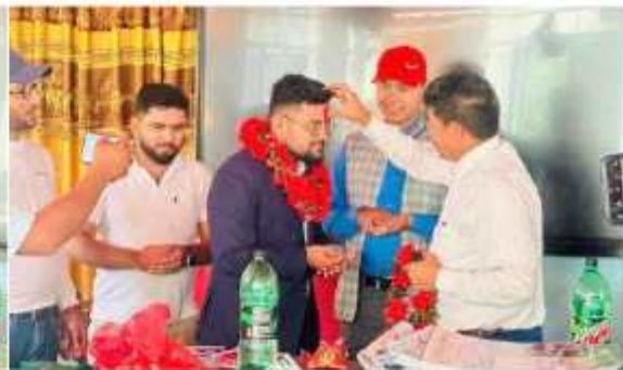
"स्वागत तथा परिचयात्मक कार्यक्रम"