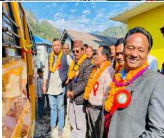
बागमती प्रदेश सरकारबाट श्री जनविकास माध्यमिक विध्यालय, खानीखोला-५ का लागि प्राप्त स्कूल बसको उद्घाटन गर्दाको केही भ्रमकहरू