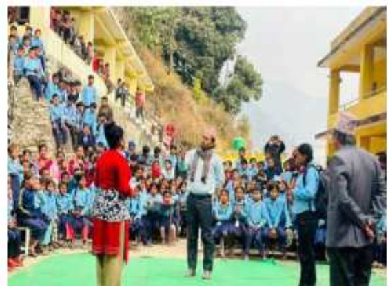
खानीखोला गाउँपालिकाको आर्थिक सहयोगमा सन्देश मुलक सडक बाटोकामकुरो शिर्षकमा स्कूलहरूमा प्रदर्शन गर्दाको भलक