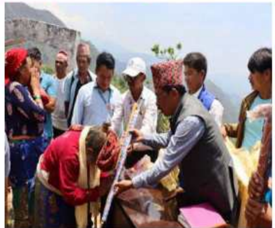
खानीखोला गाउँपालिका वडा नं. ७ मा जेष्ठ नागरिकहरूलाई गाउँपालिकाद्वारा छाता र लीरो वितरण गर्दाको केही भलकहरू ।