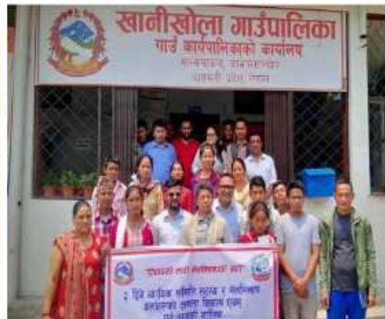
“विवादको साटो मेलमिलापको बाटो” भन्ने मुल नाराका साथ बुई दिने न्यायिक समिति सदस्य र मेलमिलाप कर्ताहरूको क्षमता विकास एवं पुनःताजकी तालिमको केही भूलक