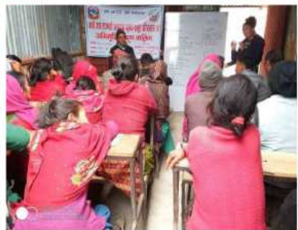
गाउँपालिकाका कृषक समूहका सदस्यहरूलाई २ दिने वडा स्तरीय कृषि तालिमको केही भलक